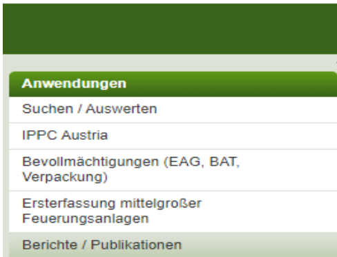
Abbildung 1 Aufruf der Anwendung „Lebensmittelweitergabe“